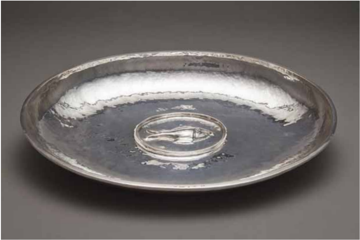
Le Poisson argent 6 x 43 x 31 cm