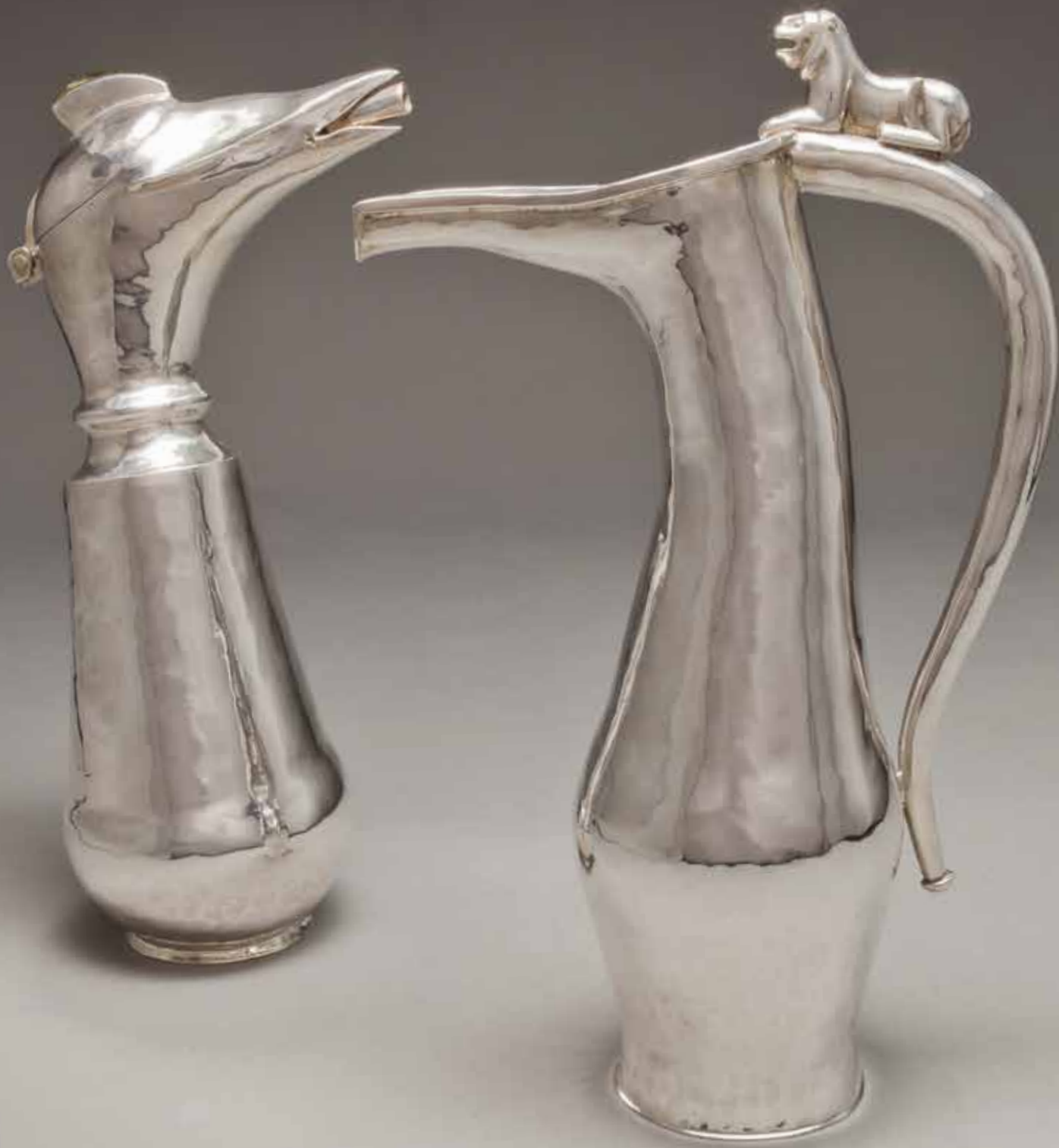
L'Aiguière au lion argent 30 x 19 x 9 cm