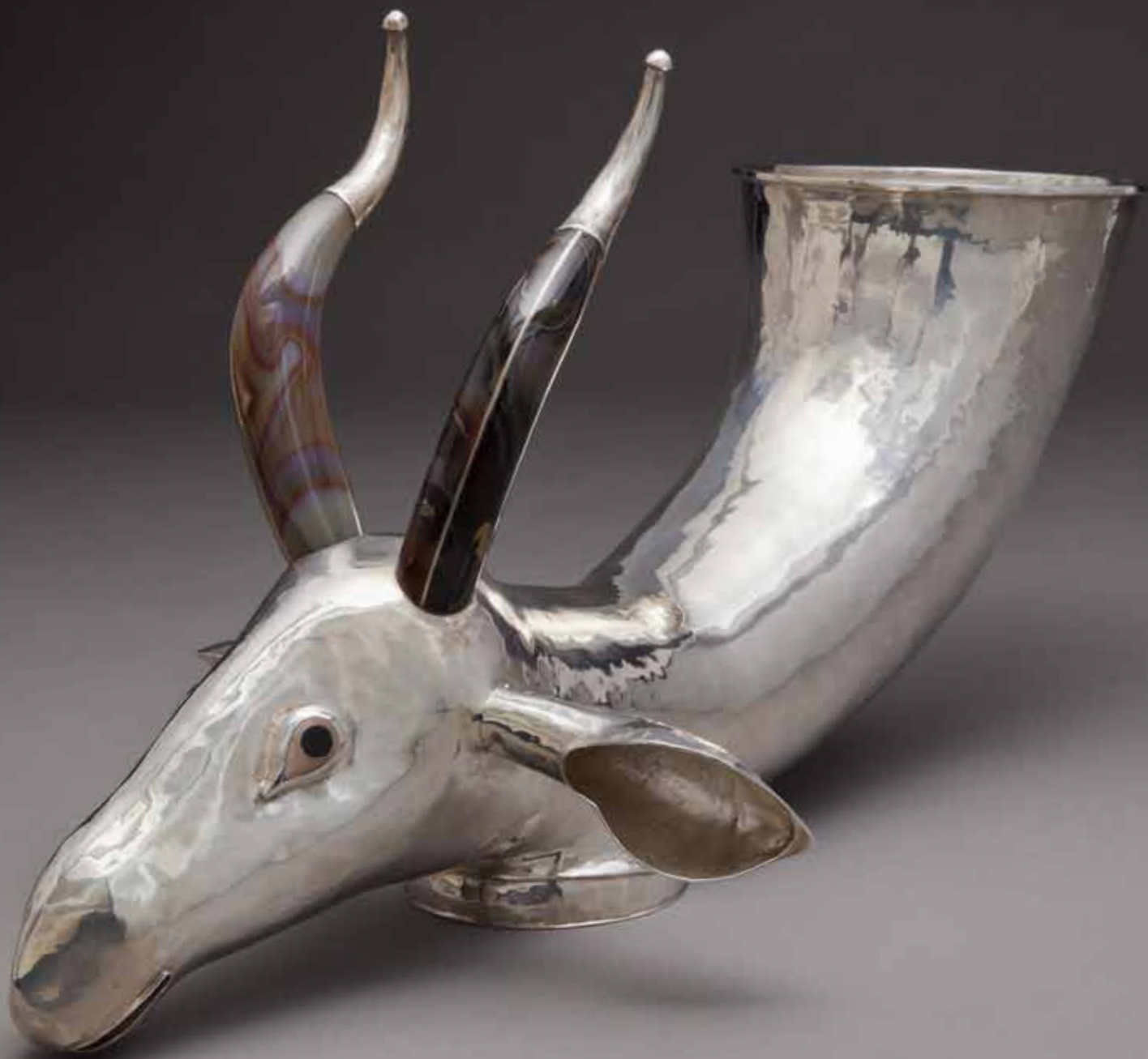
Les Yeux Noirs, rhyton argent, agate 26 x 52 x 18 cm