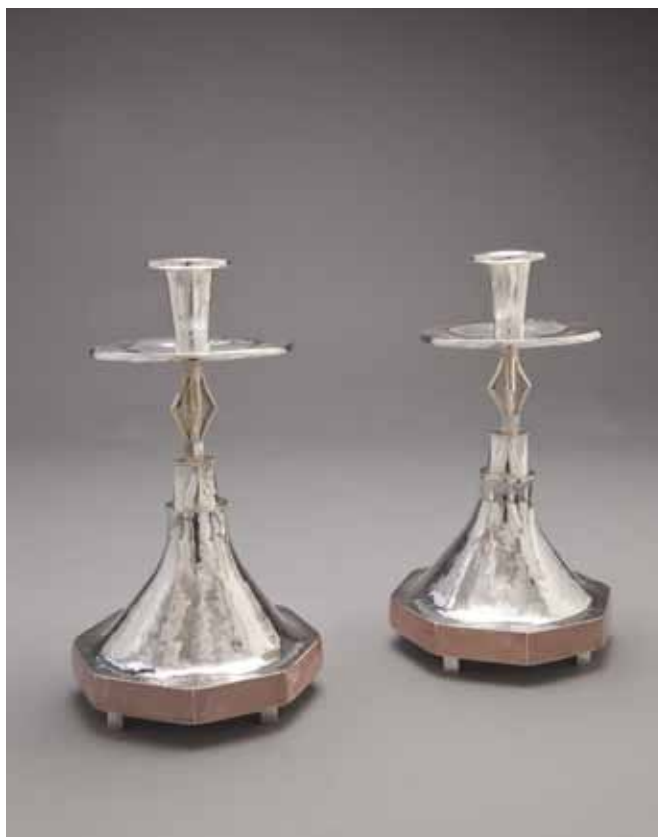
Chandelier argent, quartz rose 24 x 14 x 14 cm