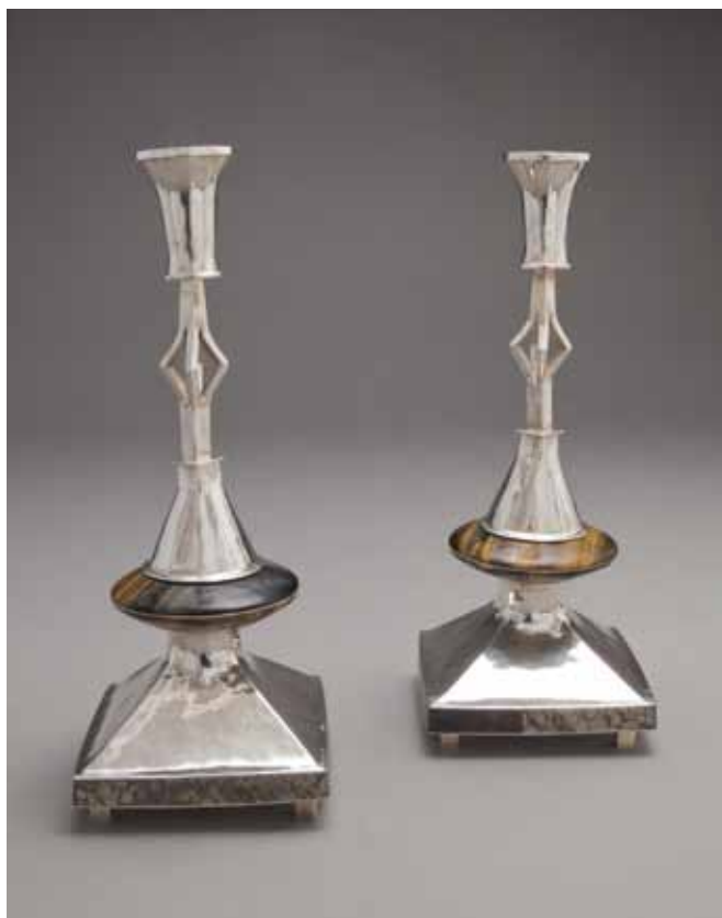
Porte flamme en trompette argent, œil-de-tigre, hématisite 28 x 11 x 11 cm